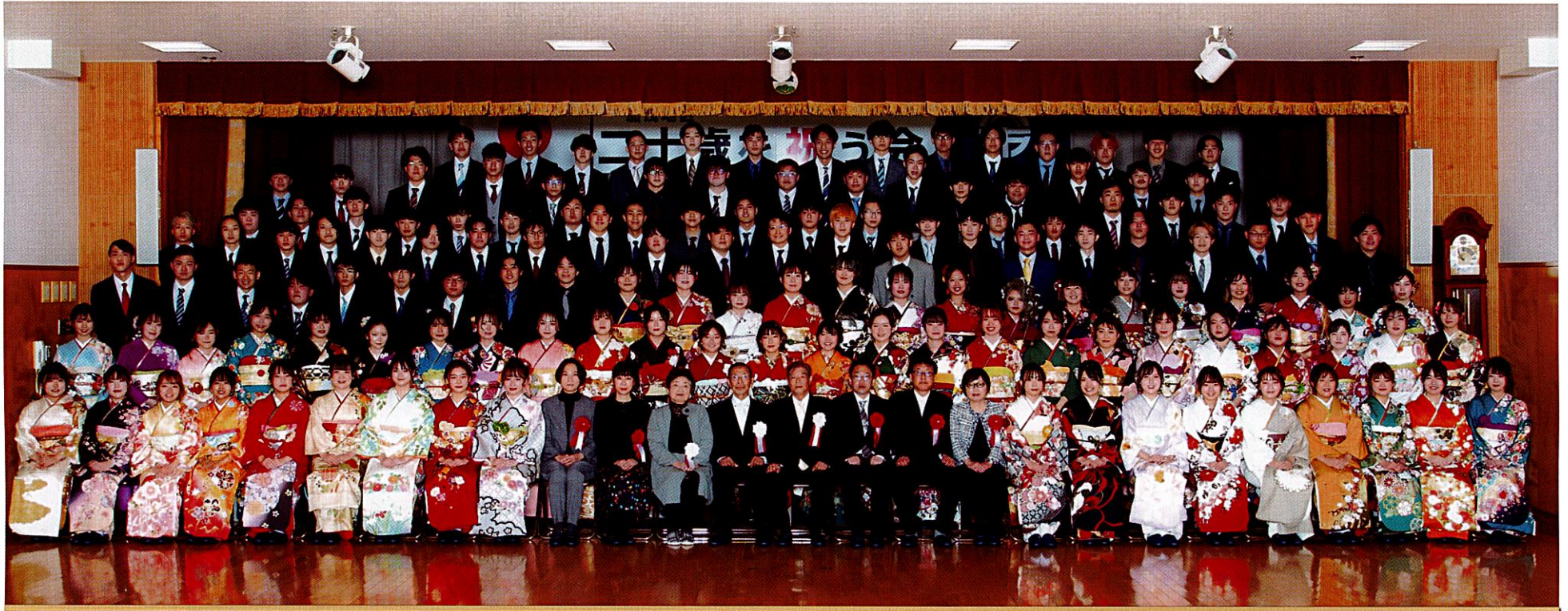
祝 二十歳を祝う会：令和5年1月8日(日)

加茂コミュニティ協議会 加茂公民館 TEL088-632-1024 088-632-7699 FAX 兼用 加茂地区の人口 20,369人 世帯数 9,507世帯 (令和5年1月1日現在)